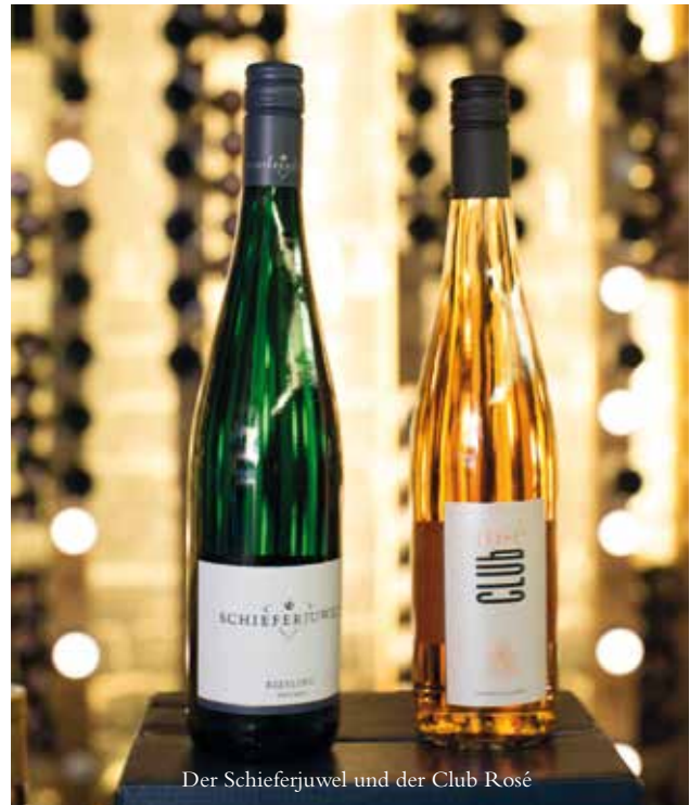
Der Schieferjuwel und der Club Rosé